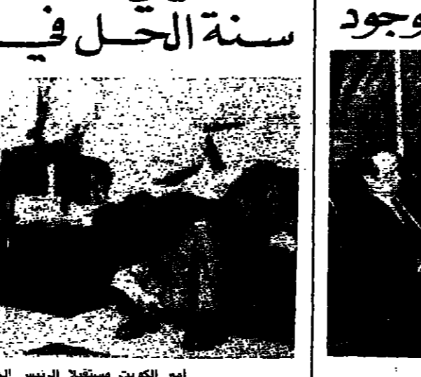
الهرابي وكولو توشا

الهرابي التقى اللقاء الاسلامي كولو توشا: الوضع اللبناني صعب... لكن الأمل موجود